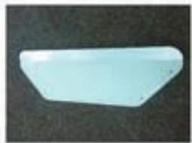
Закрылки 4 шт.

1. Проверьте комплектацию. В набор входят: