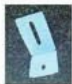
Нижний уголок 8 шт.