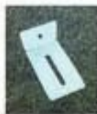
Верхний уголок 8 шт.